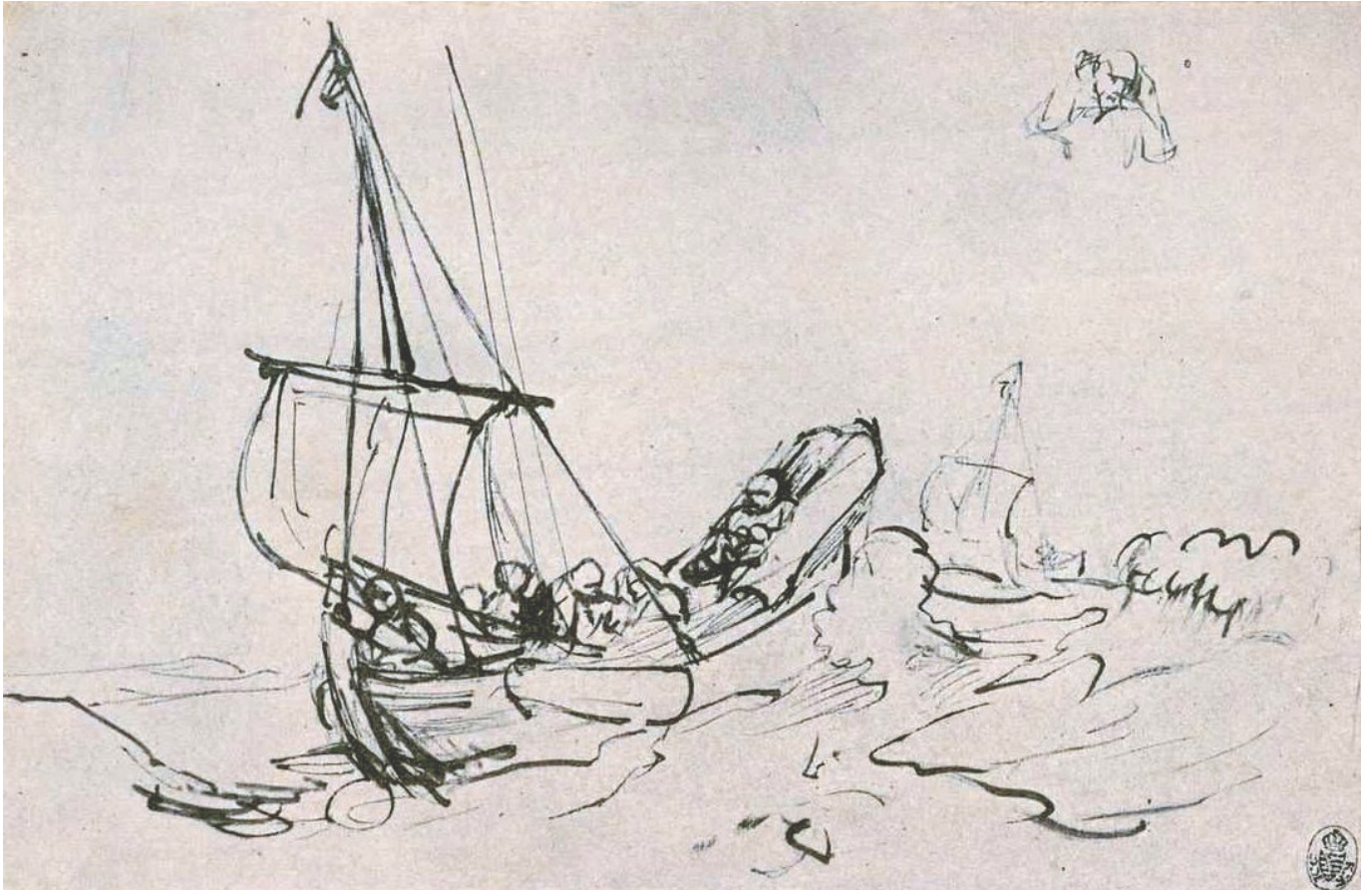
Storm op het meer van Rembrandt